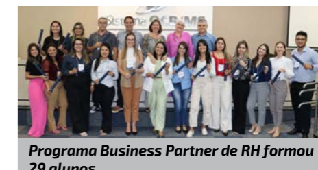
Programa Business Partner de RH formou 29 alunos

“Jornada do Colaborador”, da Sicredi Campo Grande, seguido pelo projeto “Simulador de Negócios”, da C. VALE em 2º lugar. E em 3º lugar, o projeto “Programa Vivendo Bem”, da cooperativa LAR.