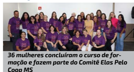
36 mulheres concluíram o curso de formação e fazem parte do Comitê Elas Pelo Coop MS