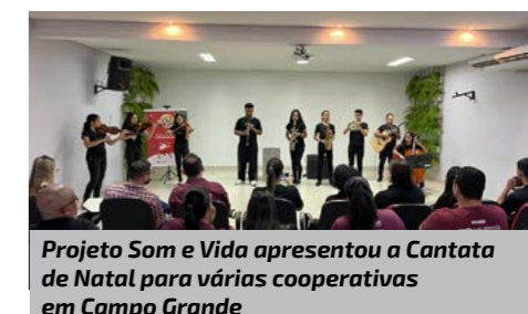
Projeto Som e Vida apresentou a Cantata de Natal para várias cooperativas em Campo Grande

Os alimentos arrecadados serão distribuídos para instituições sociais.