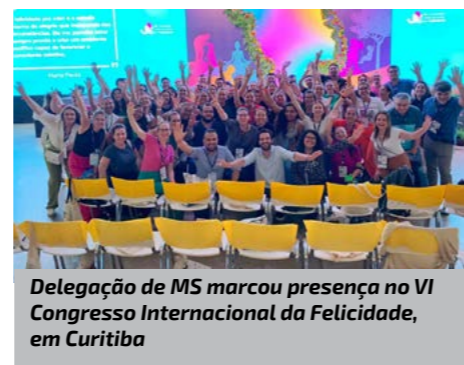
Delegação de MS marcou presença no VI Congresso Internacional da Felicidade, em Curitiba

O FIC - Felicidade Interna do Cooperativismo é um programa que tem como objetivo estimular e apoiar as iniciativas das cooperativas voltadas para o bem-estar e a qualidade de vida dos seus colaboradores. O programa consolida ações em torno de um processo sistêmico que melhore os níveis de qualidade de vida das pessoas, tendo como premissa a felicidade individual e coletiva.