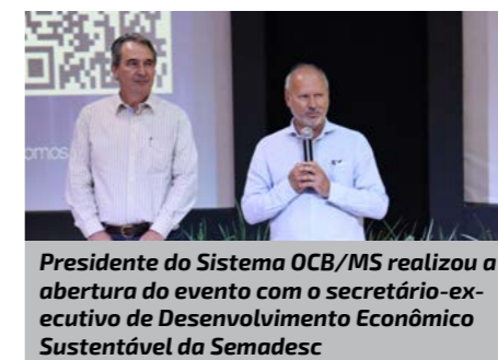
Presidente do Sistema OCB/MS realizou a abertura do evento com o secretário-executivo de Desenvolvimento Econômico Sustentável da Semadesc