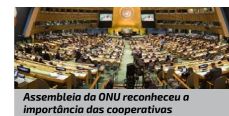
Assembleia da ONU reconheceu a importância das cooperativas

"Incentivamos todos os Estados-Membros a aproveitarem o ano