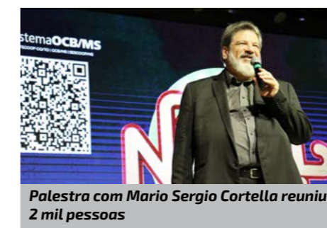
Palestra com Mario Sergio Cortella reuniu 2 mil pessoas

A cooperativa que mais doou insumos foi a Unimed Campo Grande, com 5,5 toneladas de alimentos e 46 brinquedos, e pôde entrar no camarim e tirar foto com Mario Sergio Cortella. A Copasul ficou em segundo lugar ao doar 3 toneladas de alimentos e 1.229 brinquedos, e teve dez lugares reservados na primeira fileira da palestra. Em terceiro lugar, a Sicredi