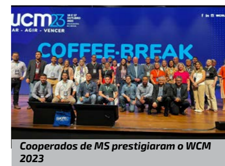
Cooperados de MS prestigiaram o WCM 2023

Desde 2015, o evento proporciona conhecimentos inovadores e desenvolvimento de novos métodos e conceitos para o cooperativismo. Presidentes e dirigentes se encontram para interagir com o público e os principais players do mercado. A edição deste ano teve como tema “Criar, agir e vencer num mundo em constante evolução.” A proposta do WCM23 é buscar a prática, a ação e a aplicação de