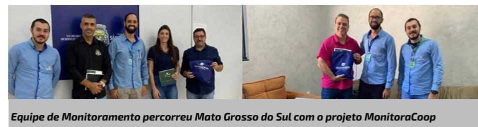
Equipe de Monitoramento percorreu Mato Grosso do Sul com o projeto MonitoraCoop

Durante os cinco meses, foram visitadas 36 cidades do estado, onde foram realizadas 21 reuniões