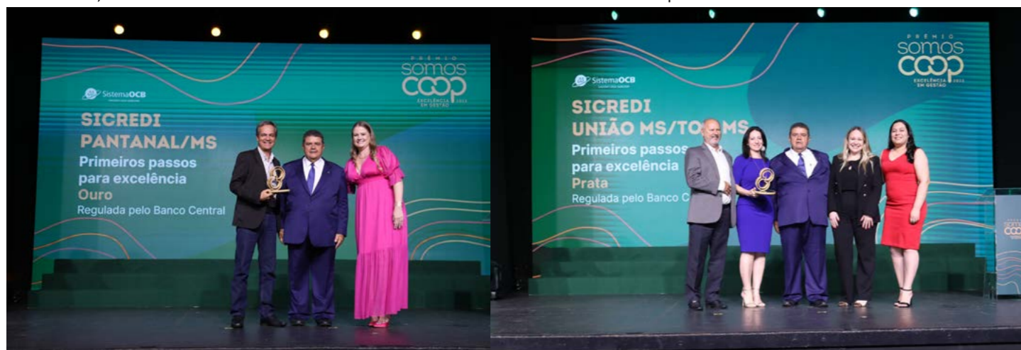
Sicredi Pantanal MS e Sicredi União MS/TO foram reconhecidas na categoria Primeiros Passos para excelência

Excelência em Gestão. O selo é um distintivo de honra para as cooperativas que buscam aprimorar suas práticas em governança e gestão, e representa uma resposta às necessidades expressas pelo Sistema OCB e pelas Organizações Cooperativas Estaduais (OCEs) que participam ativamente do Comitê responsável pelo desenvolvimento do diagnóstico de Governança e Gestão.