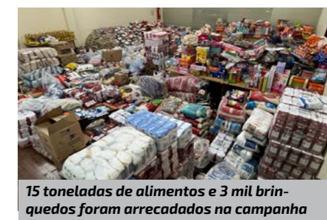
15 toneladas de alimentos e 3 mil brinquedos foram arrecadados na campanha