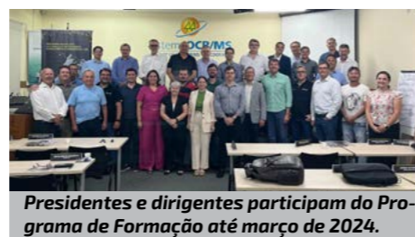
Presidentes e dirigentes participam do Programa de Formação até março de 2024.

Com carga horária de 42 horas, o programa termina em março de 2024. A primeira e última disciplinas serão na modalidade presencial, em Campo Grande. As demais disciplinas serão on-line, ministradas por professores da FDC.