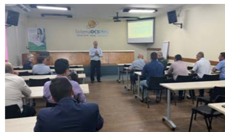
Assembleia Geral Extraordinária reúne presidentes de cooperativas

Ambas foram aprovadas e também houve discussão sobre diversos assuntos de interesse das cooperativas do estado, como o Encontro Estadual do Cooperativismo que ocorreu logo depois, a campanha social do “Natal da Cooperação” e alteração do estatuto social da OCB/MS.