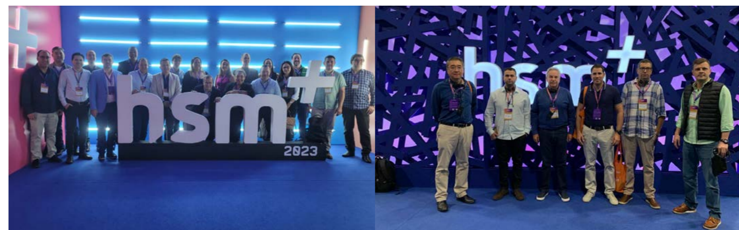
Delegação de MS com 94 representantes participou do HSM+, em São Paulo.

dias de evento, os participantes puderam participar de palestras e workshops sobre os desafios do mercado global com grandes nomes do mercado, da gestão e do futuro.